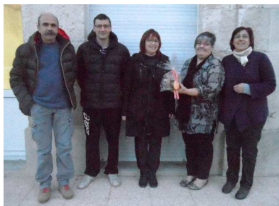
Cinq des sept bénévoles

Les élus remercient les trois preixanais qui se sont joints à eux afin d'assurer le porte-à-porte et remercient les Preixanais qui ont, comme chaque année, fait preuve d'une grande générosité.