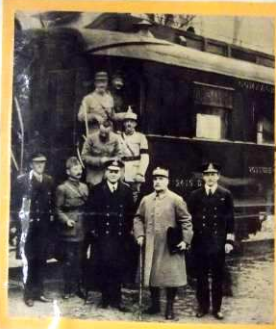
Ils ont signé à Rethondes. Foch a dans sa serviette le texte de l'armistice qu'il amenait à Paris. A sa droite, l'Amiral Weygand.