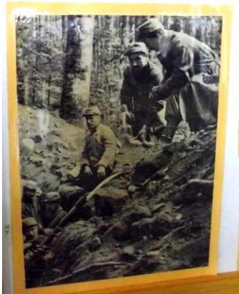
Les poilus dans les tranchées

Quelques photographies illustrant la vie des soldats sur le front et la signature de l'armistice.