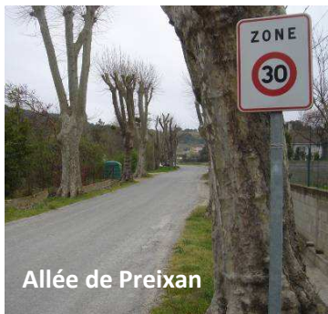
Allée de Preixan