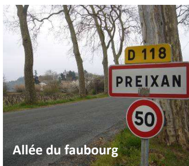
Allée du faubourg