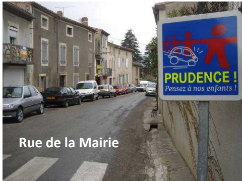
Rue de la Mairie