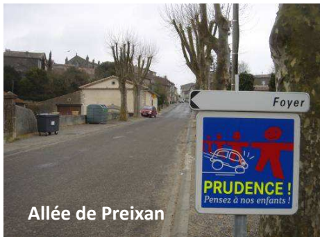
Allée de Preixan