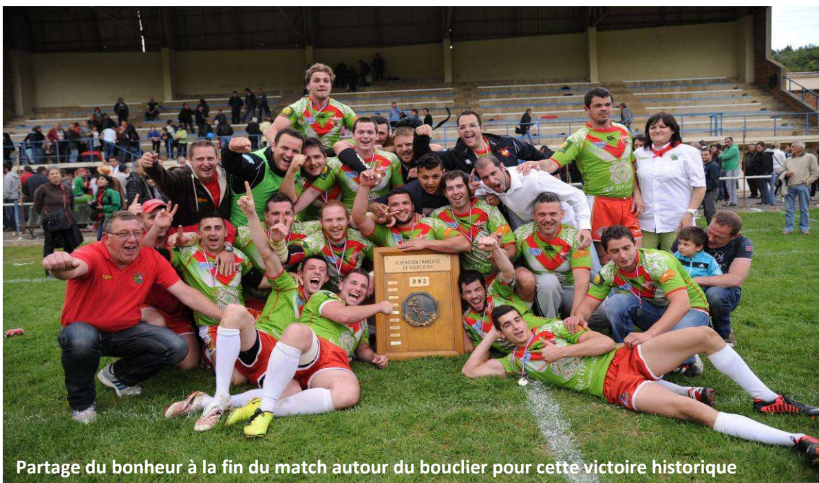
Partage du bonheur à la fin du match autour du bouclier pour cette victoire historique

Cette victoire est une sacrée récompense pour les efforts déployés par les joueurs, les entraîneurs, l'équipe dirigeante et tous les membres bénévoles depuis le début de la saison.