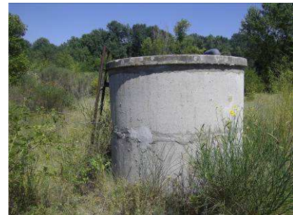
Puits « Cayrol » au Thou