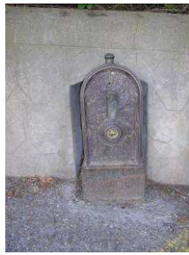
Fontaine rue de la Mairie