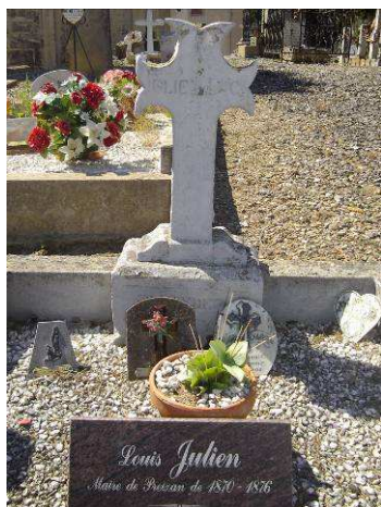
Tombe de M. Louis Julien

Ce château d'eau, appelé aussi réservoir d'eau, révolutionne en son temps par sa capacité de stockage de 200 m 3 . Grâce aux délibérations du Conseil municipal gravées à jamais sur les registres, nous allons évoquer l'histoire de l'eau à PREIXAN.