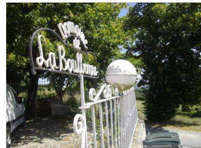
Domaine de la Boulbonne

En octobre 1913, le Conseil municipal approuve le projet, une demande de subvention est effectuée et des promesses de vente sont établies avec les propriétaires de terrains possédant la source et ceux qui laisseront passer la canalisation souterraine. Alban BROUSSE vendra un morceau de terre où sera construit le réservoir d'eau.