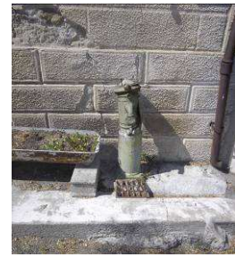
Fontaine du Presbytère