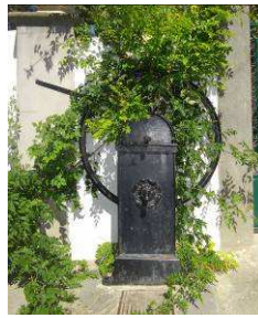
Fontaine rue de la Mairie