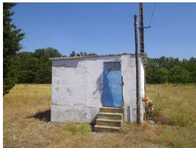
Puits « Cantier » au Thou